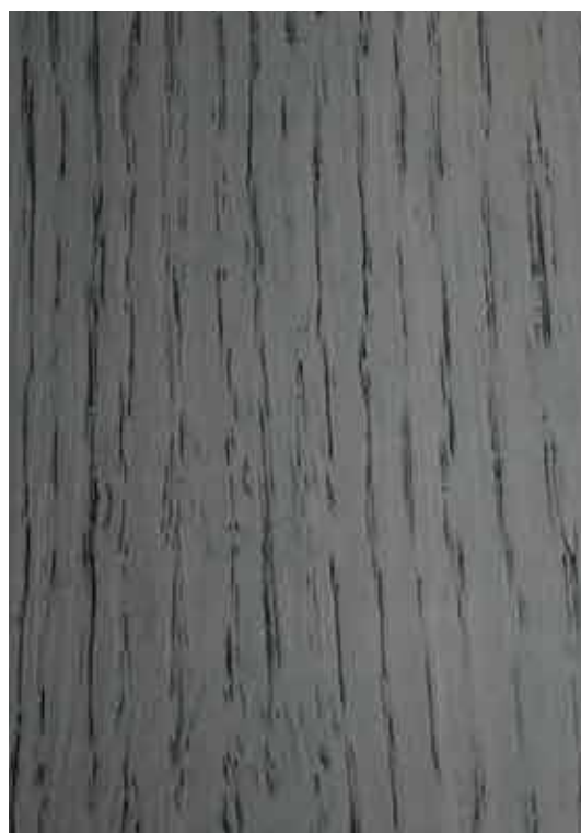
C587 - Cinza Escuro