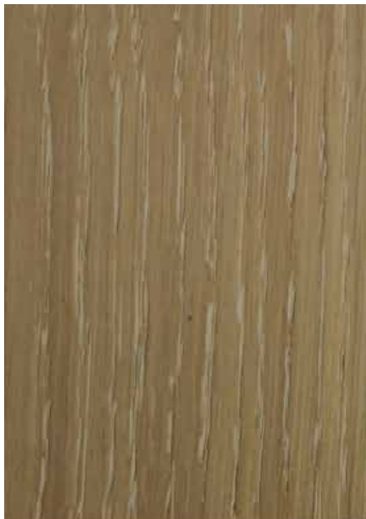
28004 - Envelhecido com Patine Retirável 12348 - Creme 5A441