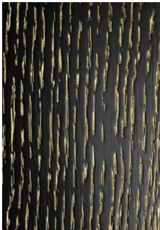
100- Preto com Patine Retirável Ouro Antique.