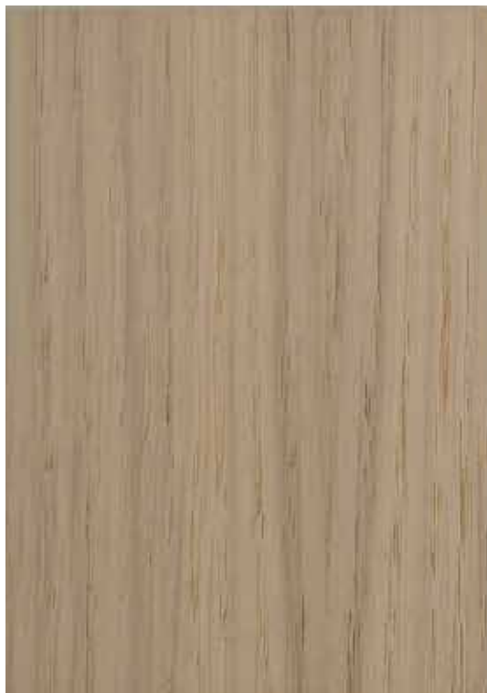
20114 - Branca

Esquema de aplicação aconselhado: Aplicação de uma demão de Velatura AP na cor pretendida. Aplicação de duas demãos de Verniz Acrílico Extra Mate. Lixar entre demãos com lixa grão 320.