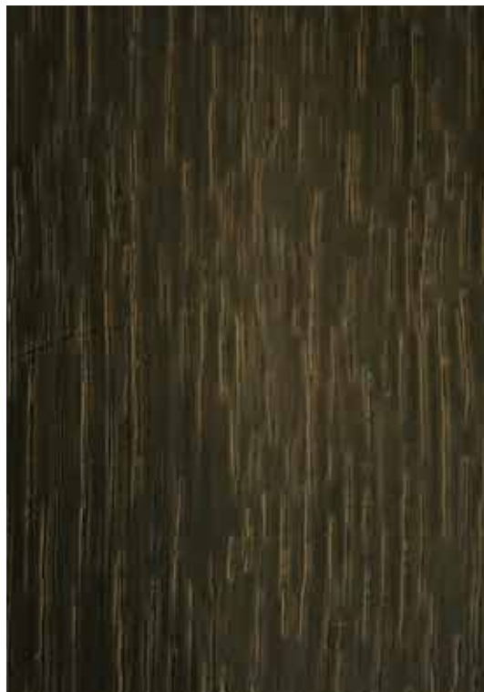
6377 - Oak