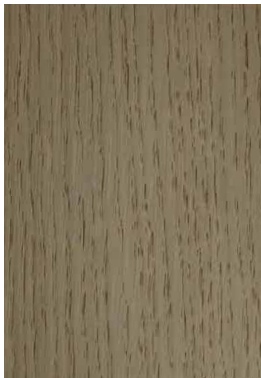
28001 - Gregé