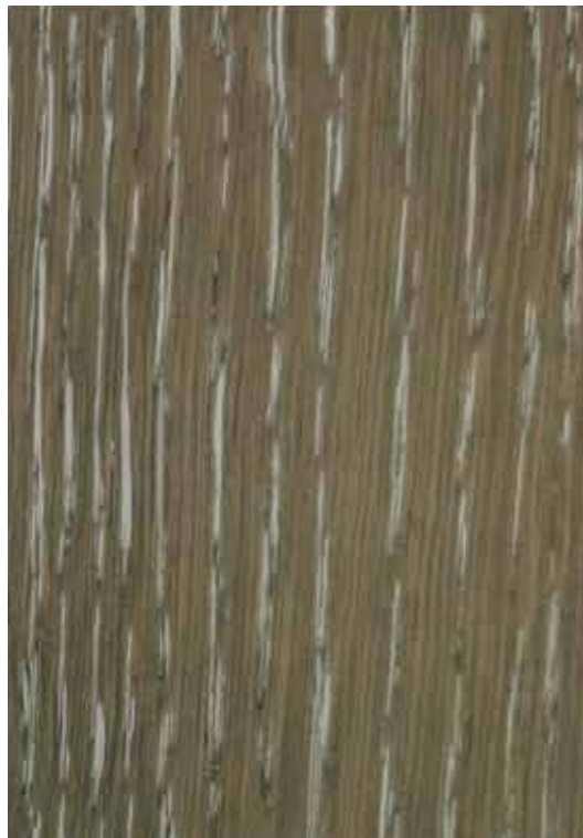
28003 - Carvalho Cinza com Patine Retirável 12348 - Branca