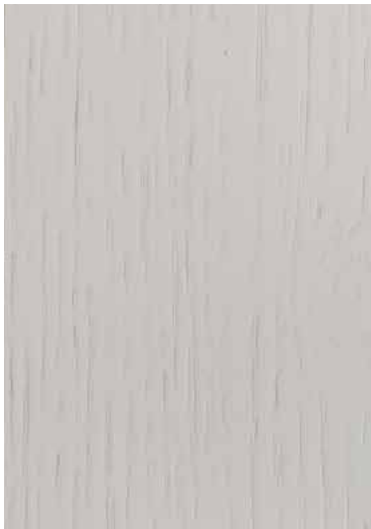
050 - Branco

Esquema de aplicação aconselhado: Aplicação da 1ª demão cruzada de Verniz Acrílico MV Brilho 1 na cor pretendida. Secagem e lixagem após 2 horas, com lixa grão 320. Aplicação da 2ª demão cruzada de Verniz Acrílico MV Brilho 1 na cor pretendida.