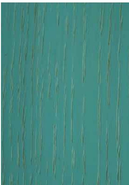
2326 - Azul