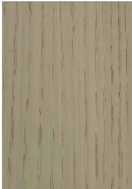
28002 - Carvalho