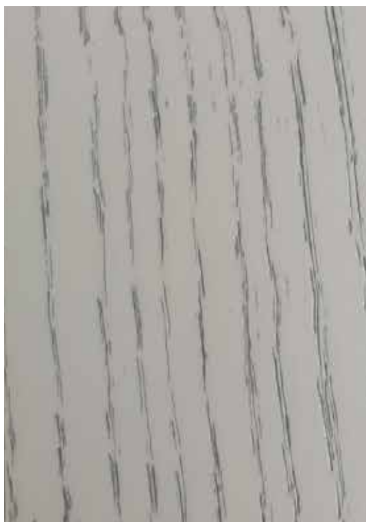
566 Branco Cinza com Patine Retirável Prata Antique

Esquema de aplicação aconselhado: Aplicação da 1ª demão cruzada de Verniz Acrílico MV Brilho 1 na cor pretendida. Secagem e lixagem após 2 horas, com lixa grão 320. Aplicação da 2ª demão cruzada de Verniz Acrílico MV Brilho 1 na cor pretendida. Aplicação da Patine, deixar secar e retirar de acordo com efeito pretendido.