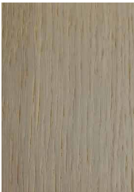
C752 - Cinza