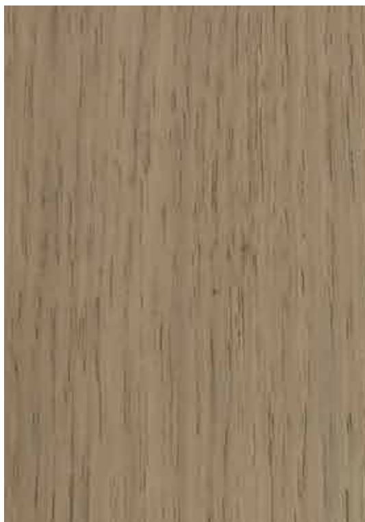
C366 - Gris Plata Oscuro

Esquema de aplicação aconselhado: Aplicação de uma demão de Veltinte na cor pretendida. Aplicação de duas demãos de Verniz Acrílico Extra Mate. Lixar entre demãos com lixa grão 320.