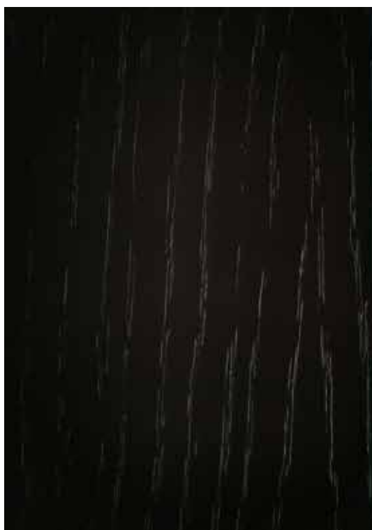
8876 - Chocolate