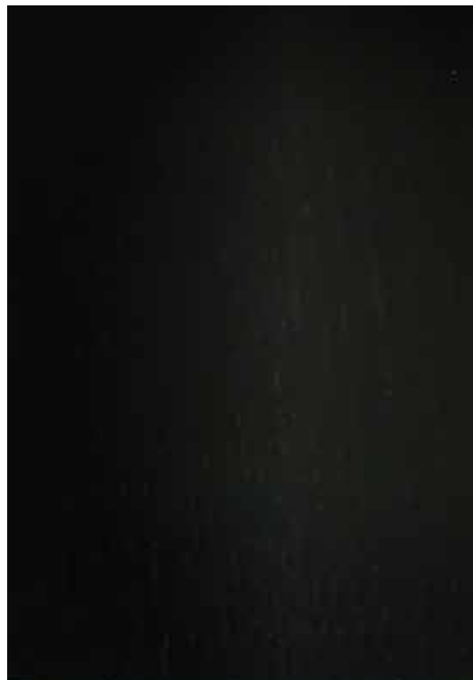
100 - Preto