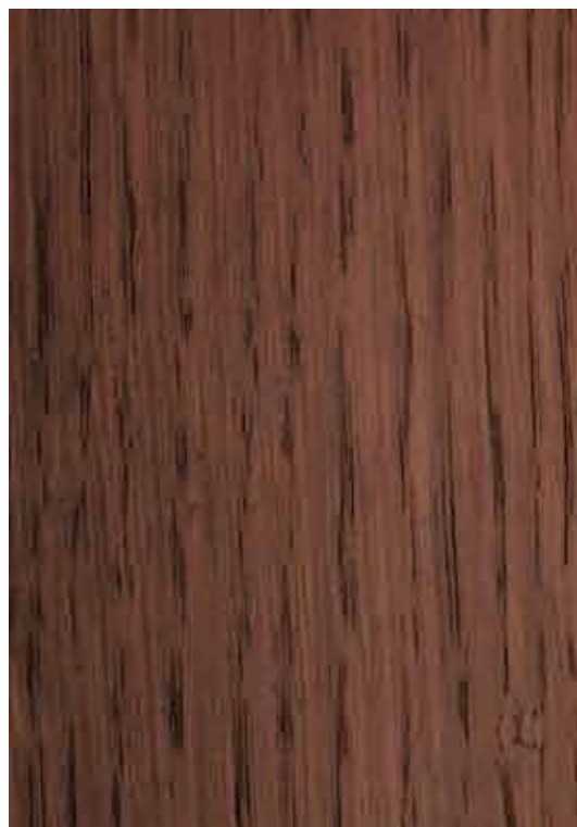
B133 - Castanha