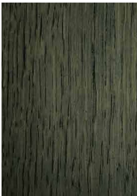
C585 - Cinza Rato