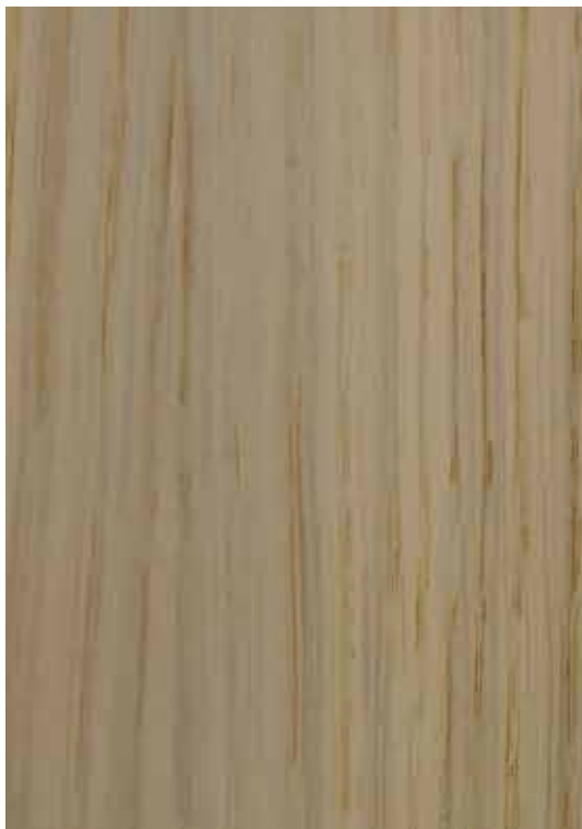
3P36 - Natur Creme

Esquema de aplicação aconselhado: Aplicação da 1ª demão cruzada de Verniz Acrílico MV Brilho 0 na cor pretendida. Secagem e lixagem após 2 horas, com lixa grão 320. Aplicação da 2ª demão cruzada de Verniz Acrílico MV Brilho 0 na cor pretendida.