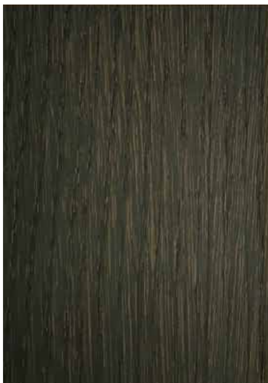
28000 - Praline

Esquema de aplicação aconselhado: Aplicação de uma demão de Velatura SR Especial na cor pretendida. Aplicação de duas demãos de Verniz Acrílico Extra Mate. Lixar entre demão com lixa grão 320.